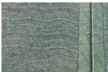
Rayado / Decorado